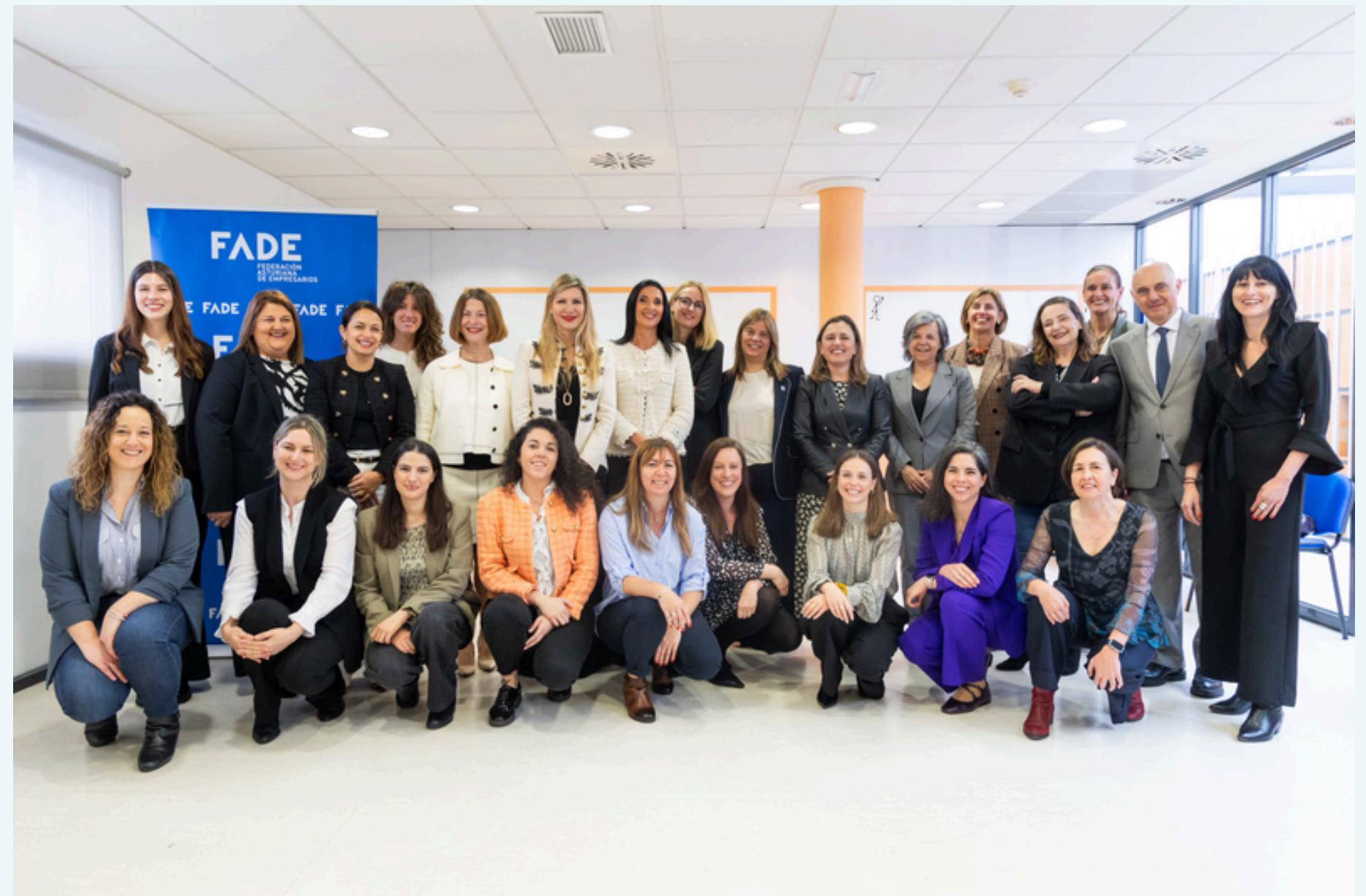
Mentoras y mentees de la primera edición durante la inauguración.

A través del apoyo de mujeres líderes, el programa brinda herramientas clave en liderazgo, comunicación, toma de decisiones y desarrollo estratégico de futuras lideresas.